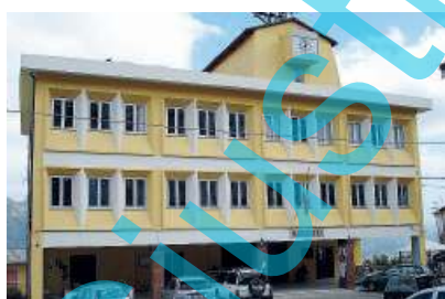
Il palazzo di città. Numerosi i punti all'ordine del giorno discussi dall'Assise

Nell'ultima seduta, il Consiglio comunale di San Mango d'Aquino ha assunto importanti provvedimenti che dovrebbero avere «una grande ricaduta sul piano sociale ed occupazionale non solo per il comune samanghese, quanto per l'intero comprensorio». Tra i vari punti all'ordine del giorno, la massimale ha analizzato infatti la questione della strada "Galasso", dell'ex Ras, dei locali comunali da concedere per la "Creative Call" di Soveria Mannelli, società di servizi per alcune delle più grandi compagnie di telecomunicazione, della solidarietà al parroco di San Mango e dei locali da accordare ad un'associazione musicale locale. Per la strada "Galasso" si è preso atto dell'accordo di programma, già