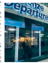
Aeroporto. Lo schermo di arrivi e partenze