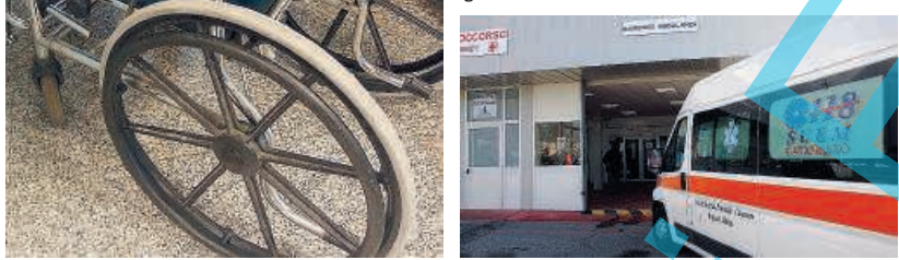
Malasanità. L'ospedale cittadino: carrozzine malmesse, sedie sporche di materie organiche, bagni per disabili chiusi

Movimenti, comitati e cittadini lamentano: là c'è una guerra di batteri