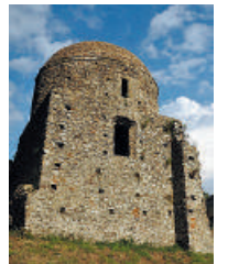
Suggestivo. Il Monastero di Sant'Elia Vecchio a Curinga

L'evento è organizzato dall'associazione «Curinga Music Festival» e nasce due anni fa con l'obiettivo di creare un appuntamento fisso e che sia capace di ritagliarsi un proprio spazio tra le date più importanti della Calabria.