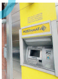
Sportello chiuso. Braccio di ferro tra sindaco e Poste

Una motivazione non condivisa dal Comune, perché l'aumento della popolazione in estate richiede un adeguamento dell'efficienza in tutti i settori, non il contrario. Nel contestare la comunicata ri-